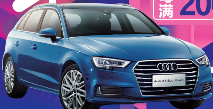
图片仅供参考,抽奖车辆以实物为准