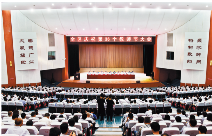
临淄区召开庆祝第36个教师节大会。

临淄区着力做好顺应教育规律的正事,坚持“定位要准、动作要稳、作风要实”的发展原则,从“三力”要求、“三个更加”到“四个必须”“五个思维”,做到遵循规律