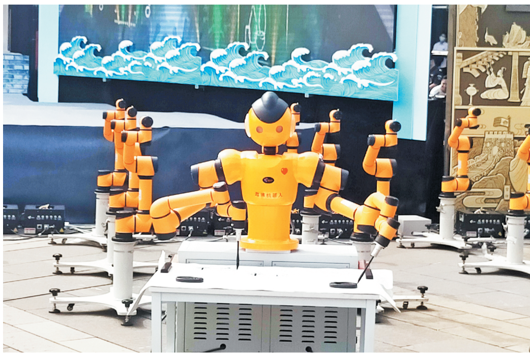
齐文化节上,由淄博公司生产的协作机器人亮相。

淄博有着开放的文化基因和传统,据史料记载,早在春秋战国时期,古代齐国就出现了我国历史上最早的自由贸易区和保税区政策;齐文化“变革、开放、务实、包容”和因俗简礼、尊贤尚功、重