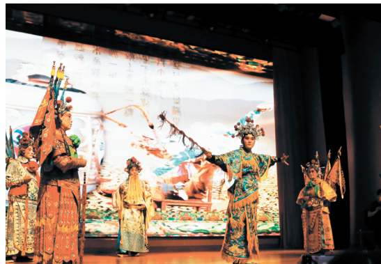
第十一届齐文化博览会暨民间收藏展开幕式上的京剧表演。大众日报淄博融媒体中心记者 李鸿斐

工厚商的精神内核和独特品质,与新时代改革开放的时代特征高度吻合。8月30日,国务院发函《关于同意设立淄博综合保税区