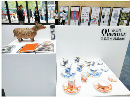
由上海视觉艺术学院设计的融合齐文化元素的文创产品,在齐文化节上展出。