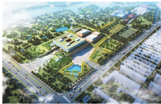
裕景·教娱城项目效果图