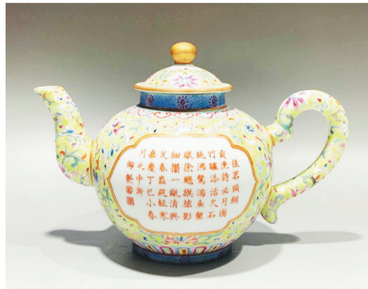
清嘉庆绿地诗文茶壶