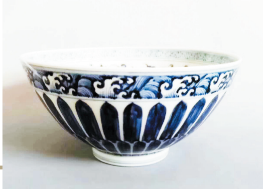
明宣德青花鸡心碗