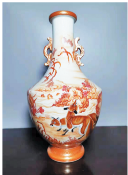
清乾隆矾红描金画狐狸双耳瓶