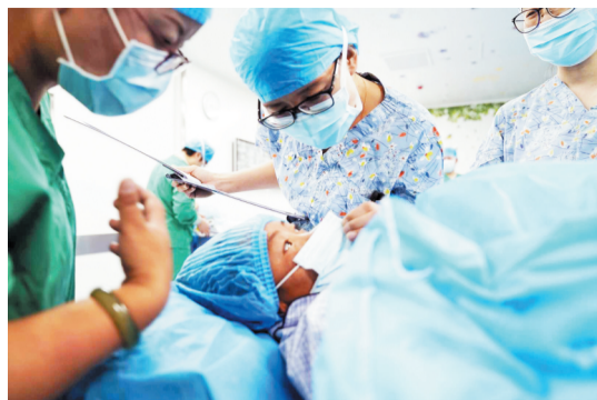
在手术室等待时,医护人员安抚先心病患儿情绪。