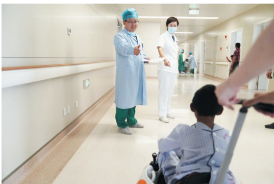
为了安抚先心病患儿的情绪,医院用电动小车载孩子们去手术室。