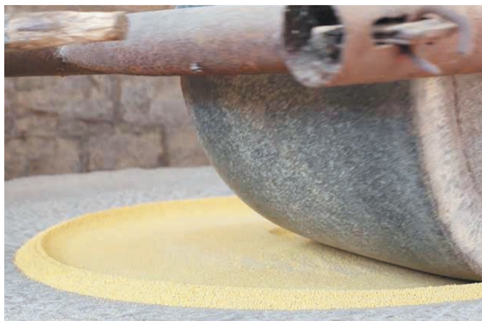
在凉泉村,人们依然习惯用石碾将谷子碾成小米。

除了苹果和板栗等果树,凉泉村种得最多的就是谷子。一块块或大或小的谷子地散落在村外的山上。对于家庭条件略好的村民们来说,每年收获的小米可以补贴家用;对于67户刚刚脱贫的村民来说,每年收获的小米即便全卖出去也只能换回千把块钱,但这却寄托着更多的希