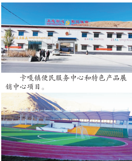
卡嘎镇便民服务中心和特色产品展销中心项目。