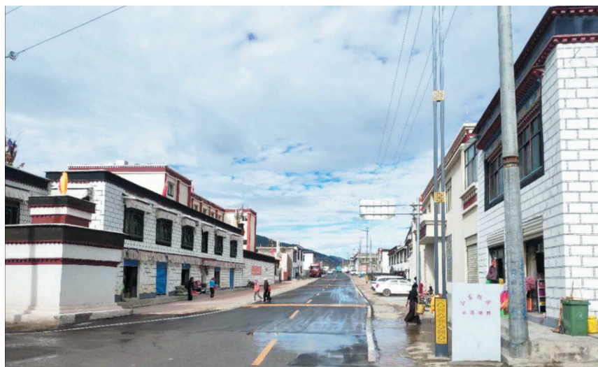
秋窝乡基础设施项目。