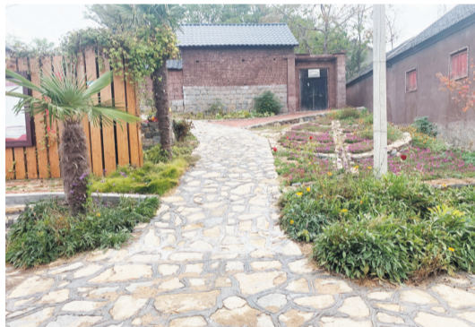
大张庄镇小官庄村。