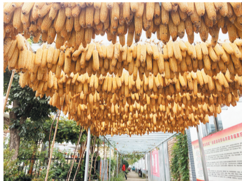
悦庄镇西辽军埠村。