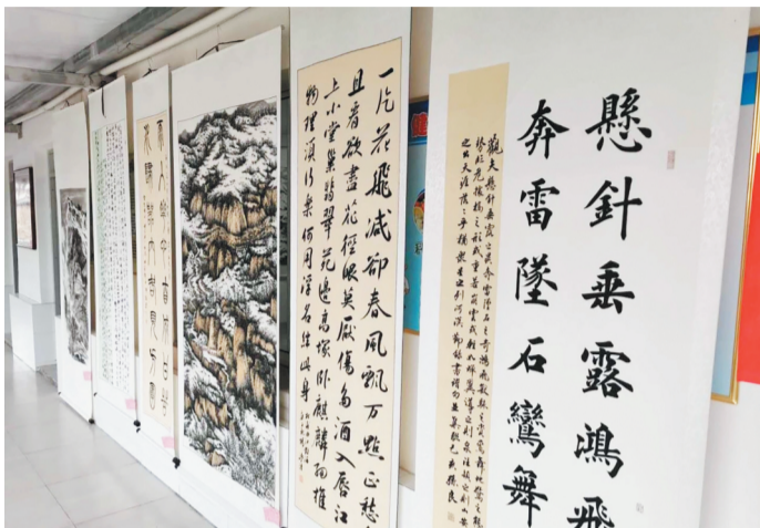
“金风玉露 情系聊斋”书画精品展展出的作品。

式开展,这是淄川区委宣传部、淄川区文联庆祝中华人民共和国成立71周年系列活动之一。活动中,展示了聊斋文化艺术学会学术成就以及洪山镇在社会主义文化建设道路上的里程碑。