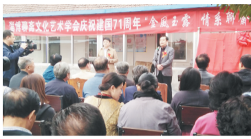
“金风玉露 情系聊斋”书画精品展现场。