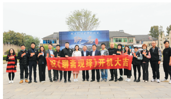
网剧《聊斋现绎》在淄川区聊斋园开机。

该故事以陆判私自为凡人续命,不慎弄丢生死簿,被阎王贬到凡间寻找生死簿为主线,结合蒲松龄先生的《聊斋志异》中的经典故事为蓝本,通过每一集的故事体现当代社会的现实和人性,在继承和传播聊斋故事的基础上,弘扬当代社会的核心价值观。同时,在影片中植入淄川当地的特色风情和当地的企业文化、企业产品。