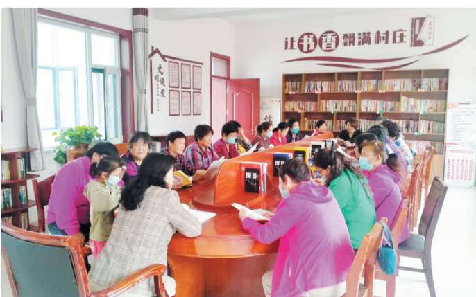
将军路街道部分居民正在开展读书会活动。

淄博10月15日讯 连日来,淄川区将军路街道举办了一系列阅读活动。公孙村举办以“金秋十月迎国庆 满怀深情读中国”为主题的读书会特别活动,大家共同回忆曾经峥嵘岁月;西关社区开展新时代文明实践“诵诗歌经典 做书香少年”青少年诗歌诵读会活动,通过诵读中华古今优秀诗歌和红色经典,让孩子们接受中华优秀传统文化的熏陶,拓宽视野,增长知识,加深他们对中华优秀传统文化的感悟和认识,了解中华民族的灿烂文化,激发爱国主义情感和民族自豪感。 通讯员 吕丝蓉