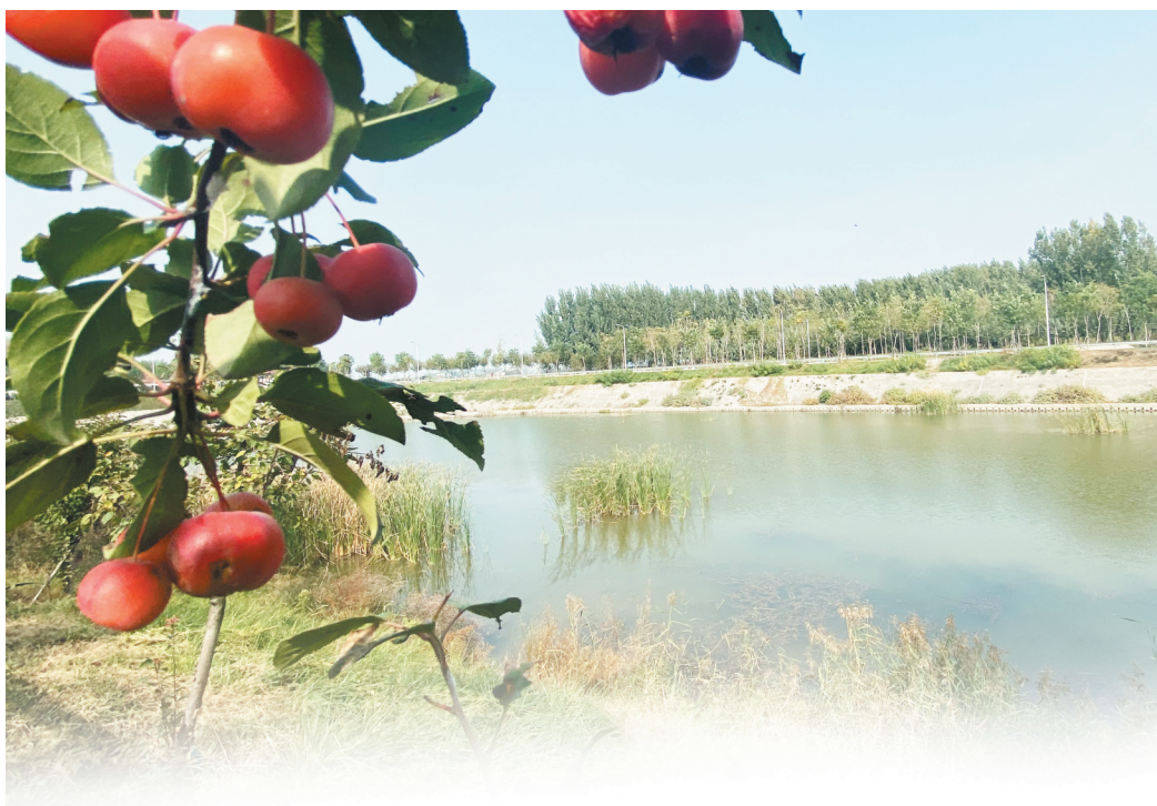
◀ 范阳河上的海棠溪地景观。