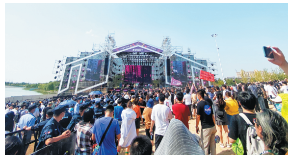
9月19日-20日,2020淄博麦田音乐节在孝妇河湿地公园阳光沙滩上激情开唱。 资料照片