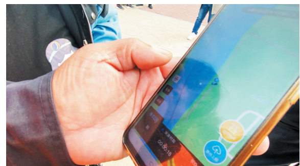
河管员当天的巡河记录通过手机APP拍照上传至信息化平台。