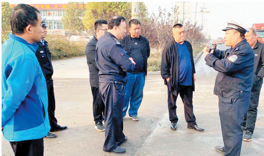
凤凰镇联合工作专班到侯家屯村现场调研隐患路段。