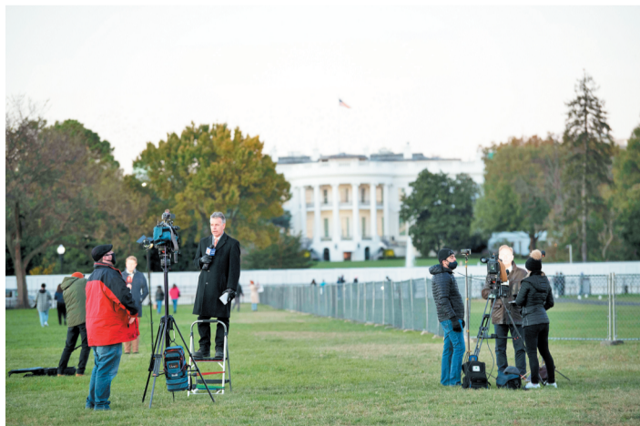
11月2日,媒体记者在美国华盛顿的白宫前报道大选。