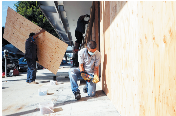
11月2日,美国洛杉矶县贝弗利山市商业区的商家将店铺门窗封上。为应对美国大选可能出现的抗议或骚乱,贝弗利山市不少商业区开始加强防护和安保。

学者安妮·彼得森说,这种“疲惫感”不仅缘于对疫情或谁将赢得选举的担忧,“更重要的是,我的社区、我的州和我的国家,将如何从这场公共卫生和经济灾难