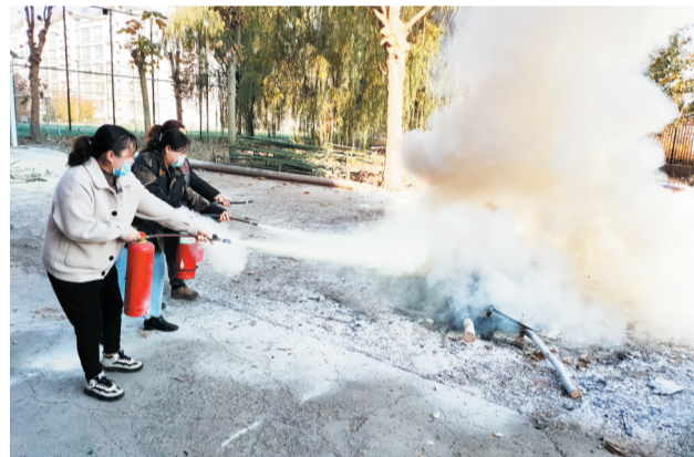
宿管员参加消防演练。