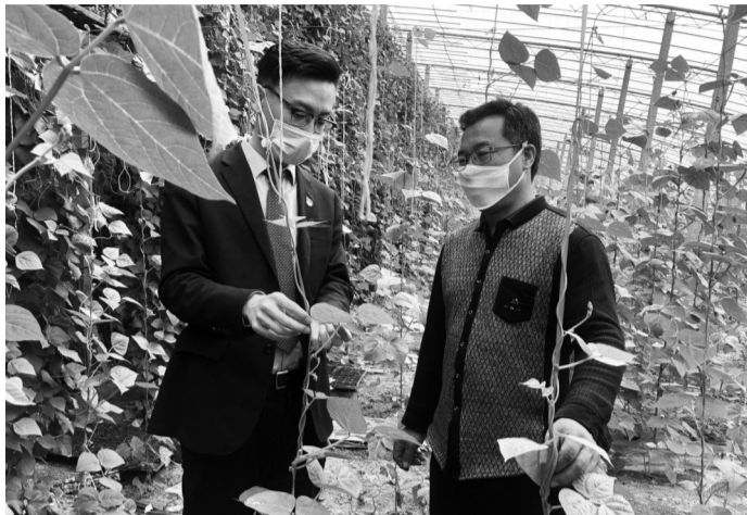
临淄农商行工作人员在田间地头,向种植户推广“鲁担惠农贷”。