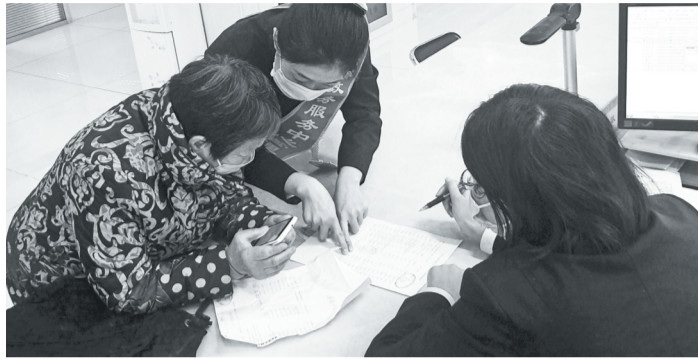
桓台县政务服务中心工作人员帮市民查询退休金发放情况。