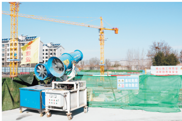
▲ 项目现场,雾炮机随时待命。