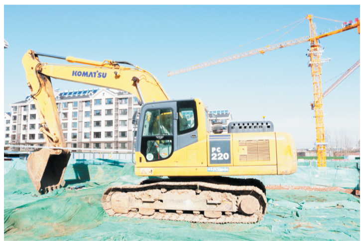
施工现场带有“环3”标志的挖掘机。