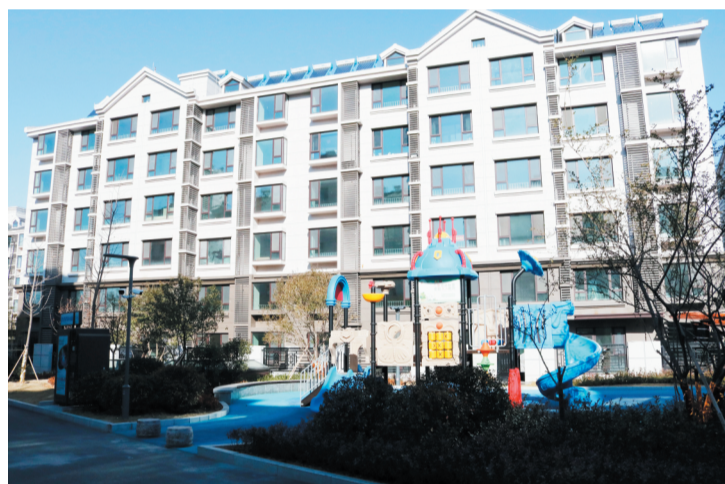
锦绣淄江一期内容。