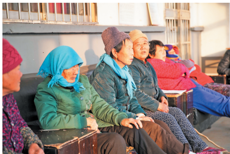
11月24日下午,在金阳村村委大院,几名村民在阳光房里闲坐聊天。