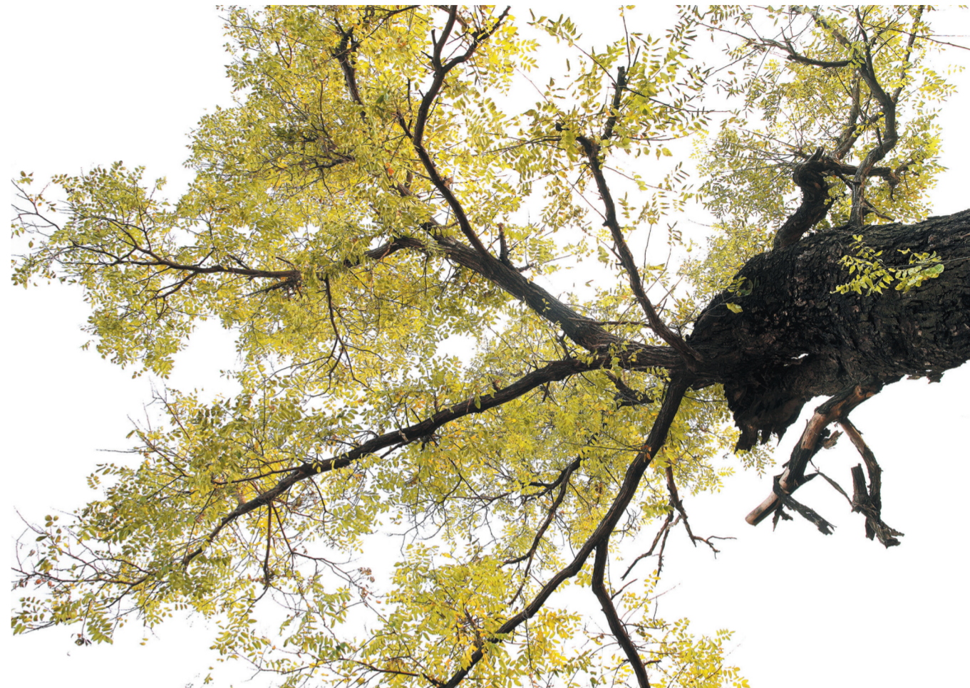
陆学贞老人家中有棵老槐树,虽已是初冬时节,老槐树依然枝繁叶茂。

“金水塘东边的山叫银山,西边的那座是金山。你们去金山看看吧,可好了!”11月24日,一名当地村民站在塘边自豪地说。