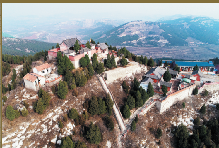
金山之巅建筑众多,错落有致。