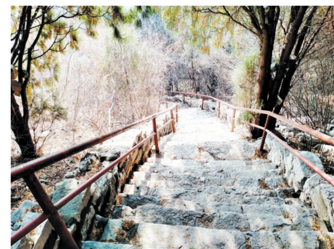
陡峭的金山十八盘,爬起来费力又赏神。