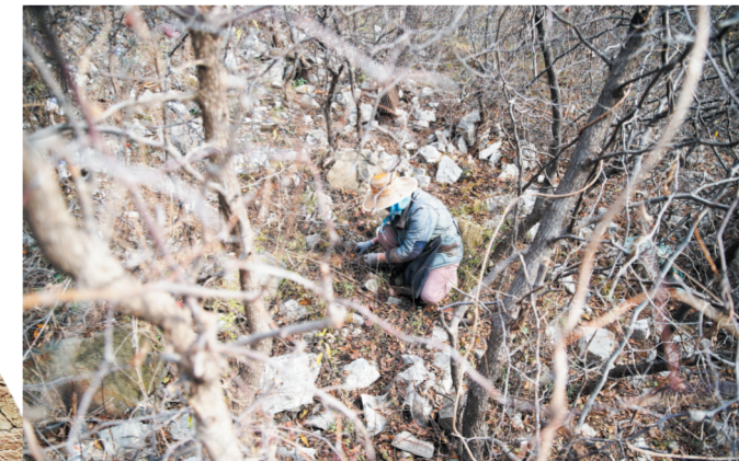
金山上植被丰富。11月24日中午,一名村民到山上捡拾酸枣。