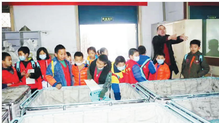
工作人员给小记者讲解如何分拣邮件。