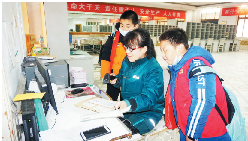
小记者观看工作人员扫条形码录入信息。