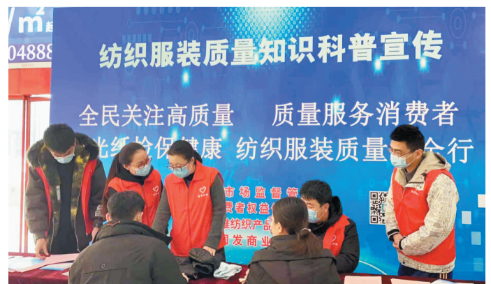
淄博市市场监管局工作人员向消费者普及质量安全知识。