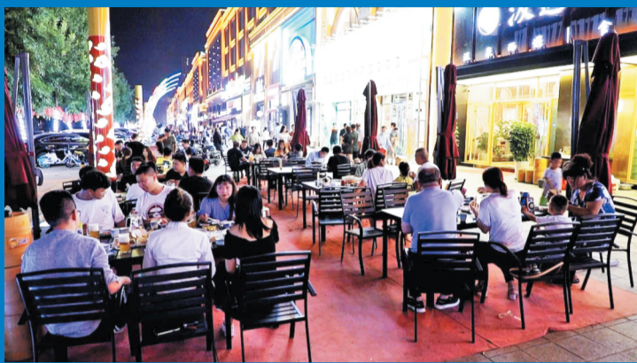
夜幕降临,三五好友相约,吃吃饭,聊聊天,成为很多市民的休闲方式之一。 资料照片