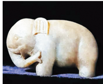
“太平有象”寓意吉祥。