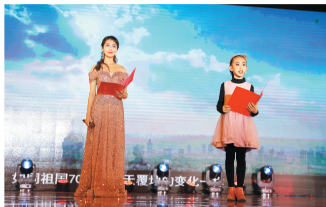
12月19日,诗朗诵节目让不少环卫工人湿了眼眶。

北接拟建的沾化至临淄高速公路,南至日兰高速 起点至青兰高速段为双向六车道,其余为双向四车道