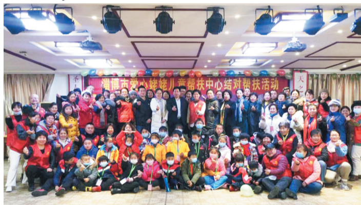
12月19日,活动人员共同合影留念。