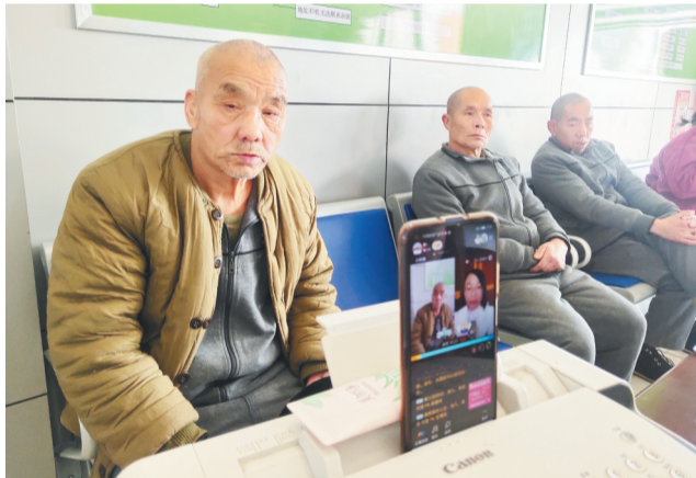
一名长期滞留受助人通过直播让更多人看到自己。

供一些个人信息以及和家乡有关的信息;对于不愿说话的和不能说话的人,救助工作人员引导他们写字、走路,动态展示个人特征。这些影像和声音通过直播间向全国关注这场直播的人公开播放。