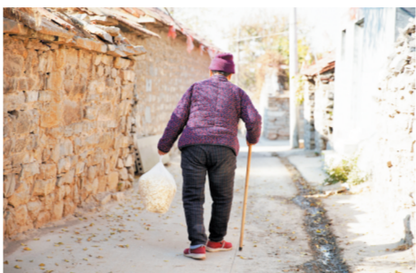
一位老人提着一袋面片走在村中小路上。