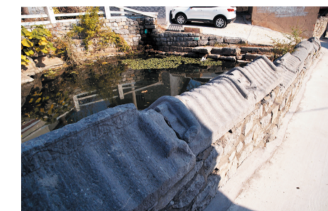
村中一座蓄水池旁的围墙,成了一座露天“碑帽博物馆”。