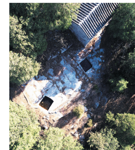
在村南山顶的玉皇庙后,村民直接在石上开凿了水池。