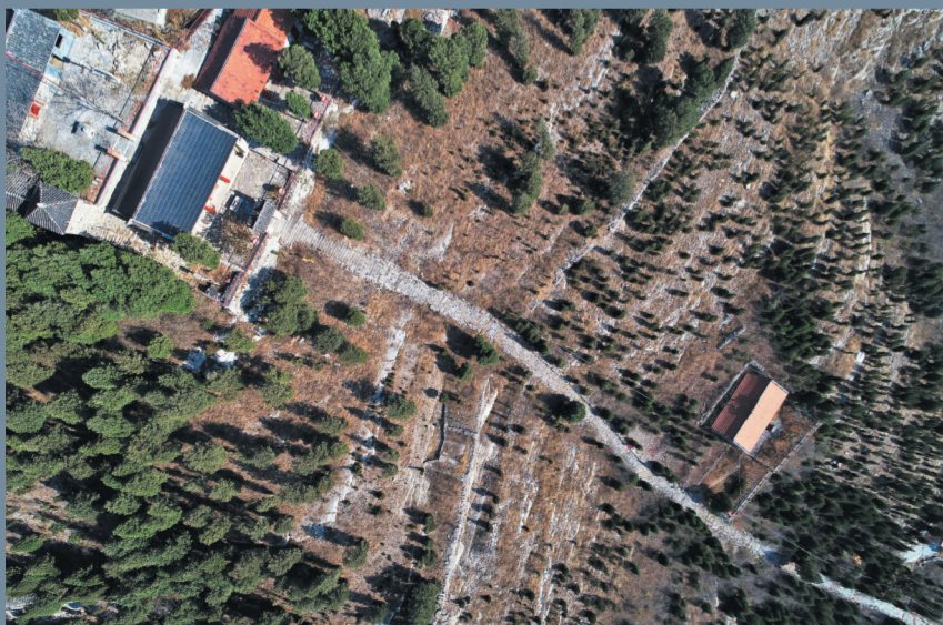
通往村南山顶玉皇庙的台阶十分陡峭。