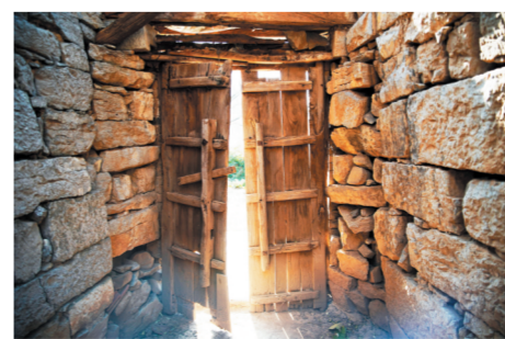
一个破旧院落的老式木制大门。