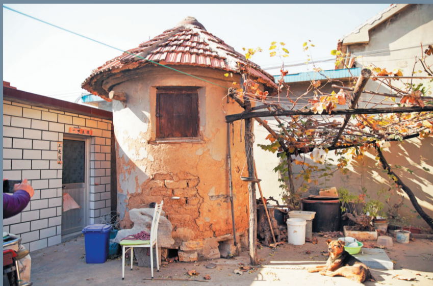
村中还保留着不少这种储存粮食的粮囤。