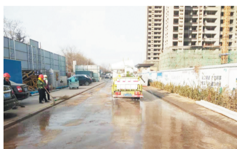
项目施工区内路面硬化,定时洒水。

处理措施,有效减少扬尘污染。建筑施工出入口、场内主要道路及生活区、工作区等都进行了地面硬化,确保地面坚实平整;闲置场地进行固化、绿化等防尘处理。建筑材料、构件、料