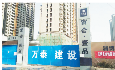
宙合·壹品项目部门口