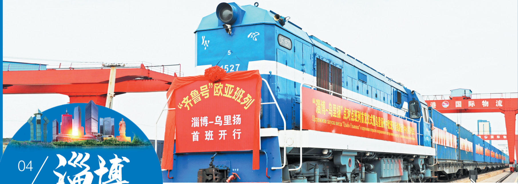
2020年6月29日，“齐鲁号”欧亚班列淄博—乌里扬首班开行。