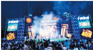
2020首届淄博青岛啤酒节带来原汁原味的国际范儿。

主动出击，为自己创造了全新增长周期的淄博，未来可期。大众日报淄博融媒体中心记者 马景阳 张继才