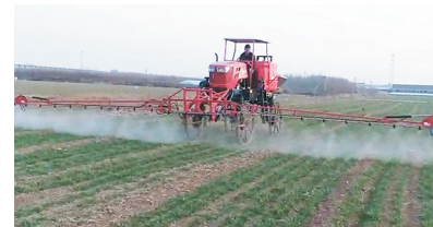
农户进行化学除草。 视频截图