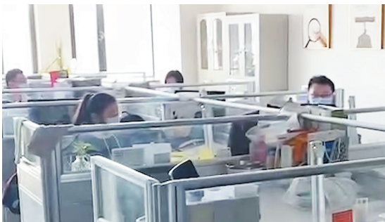
淄博合利颜料有限公司员工在工作中。视频截图