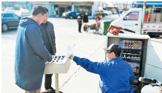
五金商铺工作人员在维修机器。