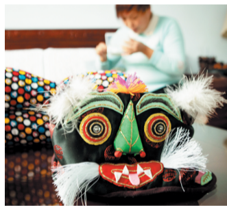
虎虎生威的虎头帽

“现在是比之前做得少了，不过大家如今又觉得，这种自己做的东西给婴儿用才舒服才放心。”这个曾经一度被冷落的非物质文化遗产，又在城乡之间盛行起来。