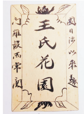
卡片的背面，中间是“王氏花园”4个字。