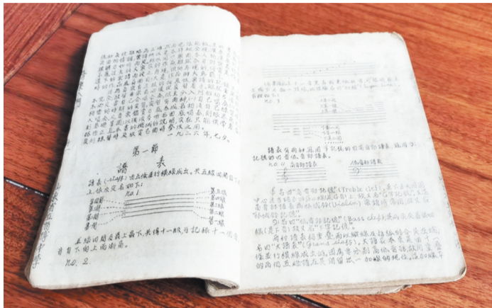
十分珍贵的音乐老教材

记者看到，这本教材为钢板油印，分为音乐入门、音乐初步、小学音乐手册、小学唱游教材、唱游教材和师二唱游教材等六个部