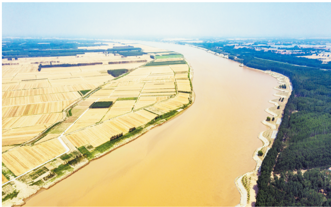
高青县是淄博市唯一的沿黄县，黄河流经该县常家镇、木李镇和黑里寨镇3个镇。

长期以来，受特殊自然地理条件和黄河防洪政策限制，黄河滩区经济发展相对滞后，群众生产生活困难，是新时期脱贫攻坚的重点区域。高青县作为淄博市