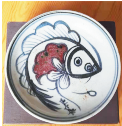
青花釉里红大鱼盘