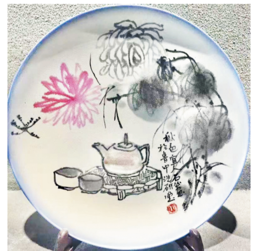
高洪刚“宣纸瓷盘”画