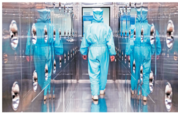
在新华医疗感控事业部,一名工人进入无尘生产车间前通过风淋室,以去除身上的灰尘。