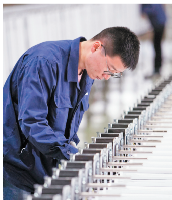
在新华医疗手术产品事业部洁净技术厂,工人正在进行医用空气净化消毒器的生产组装。