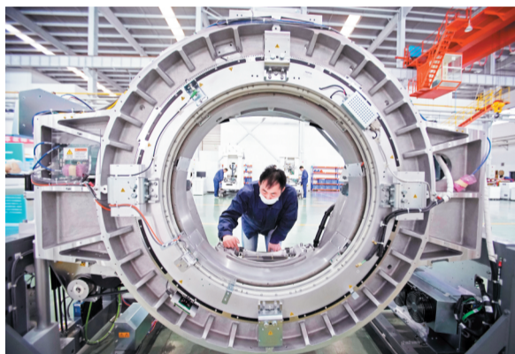
工人正在生产线上组装85cm大口径螺旋CT。