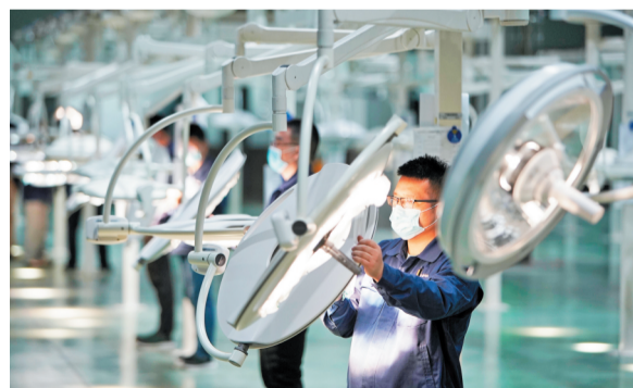
工人在生产线上调试无影灯。