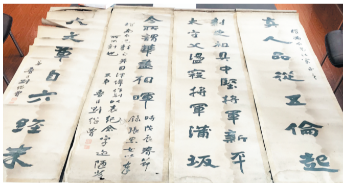
这是刘继曾写给马耀南的四条屏书法作品。

淄博5月24日讯 5月21日，一场红色传家宝捐赠仪式在博山区档案馆举行。博山地方文史专家、原博山档案局局长王济世此次捐赠的红色传家宝，是93年前一名叫刘继曾的人写给马耀南的一幅完整四条屏书法作品。