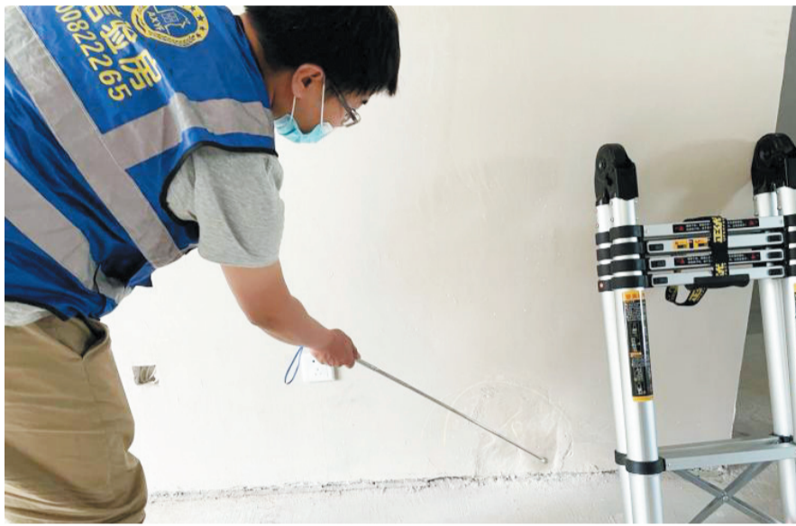
验房师在检查墙面空鼓情况。

晨报公益验房活动持续进行，有验房需求的业主可通过“晨报验房小程序”报名参与，本报将从报名新房中选择查验。