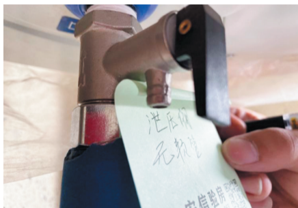
太阳能储水罐泄压阀缺少排水软管。