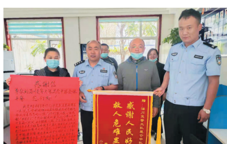
群众送来锦旗和感谢信,感谢交警危难时伸出援手。