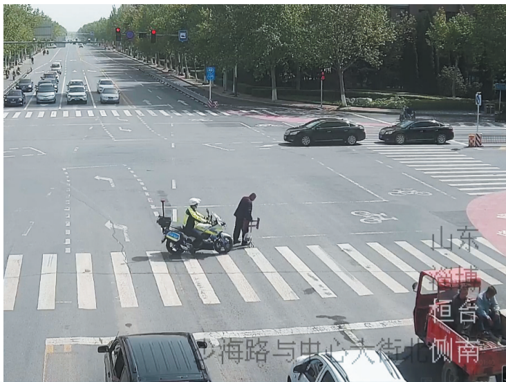
交警护送腿脚不便的老人安全过马路。 视频截图

淄博公安交警聚力道路交通管理主责主业,以“我为群众办实事”为主线,认真贯彻落实《全市政法机关开展“我为群众办实事”活动十条措施》《淄博市公安服务企业发展保障企业家干事创业十条措施》《淄博市公安服务企业发展保障企业家干事创业十条严禁》相关内容,从严从实从细做好涉及人民群众切身利益的各项工