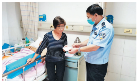
交警把道路交通事故社会救助基金送到当事人病床前。