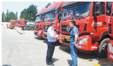
运输企业“大体检”消除交通安全隐患。