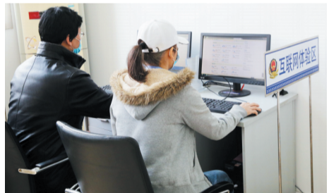
“互联网+车管体验区”方便群众网办多项业务。