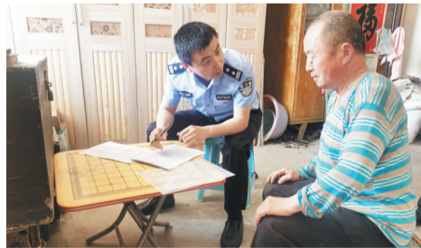
淄博公安交警开展“走千村进万户”大走访大排查大提升活动,察民情听民意。