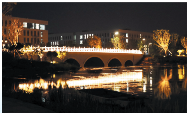
5月19日,夜色中的山东农业工程学院淄博校区,飞虹桥被灯光点亮。