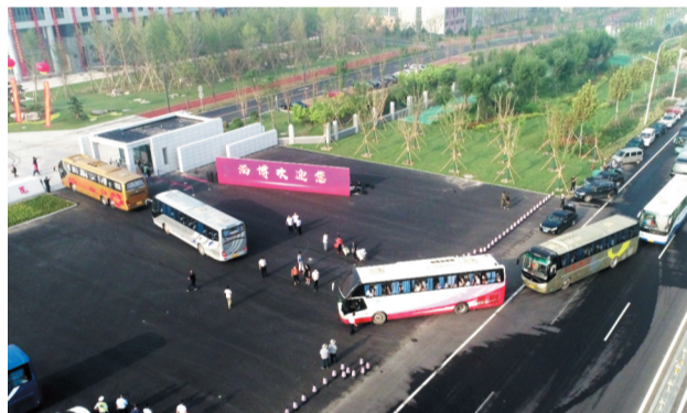
2020年8月30日,载着1200多名师生的26辆大巴车开进山东农业工程学院淄博校区。 资料照片