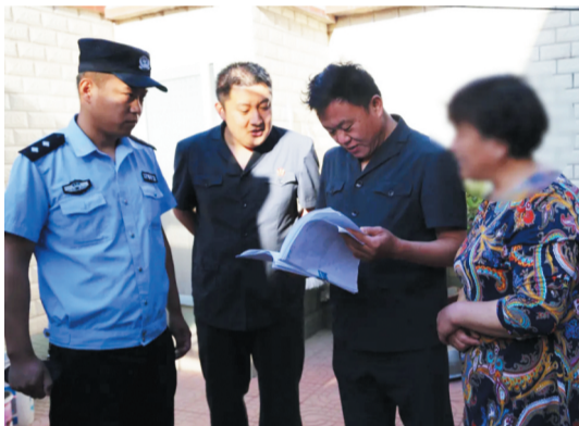
执行法官与被执行人进行沟通。