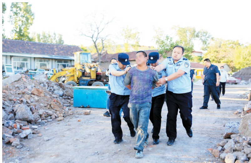
被执行人拒不配合,被采取强制措施。