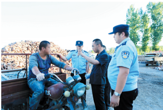
执行法官向被执行人出示证件。