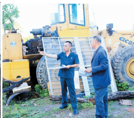
执行法官与申请执行人进行沟通。