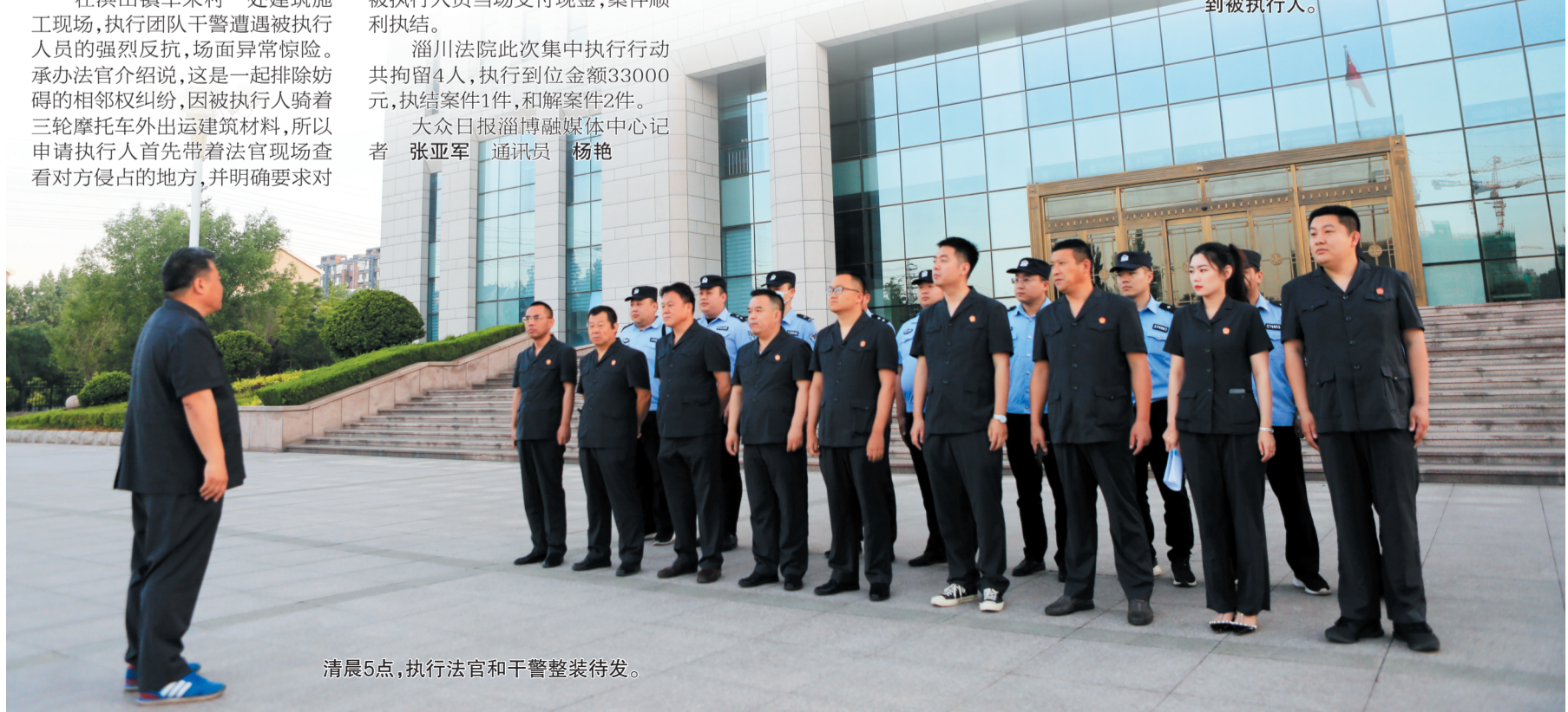
清晨5点,执行法官和干警整装待发。