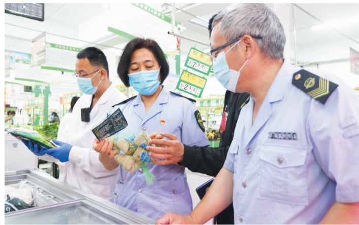
端午节前，临淄区市场监管局执法人员对商超所销售的粽子外包装上标识标签、产品生产日期、保质期、食品添加剂等进行检查。