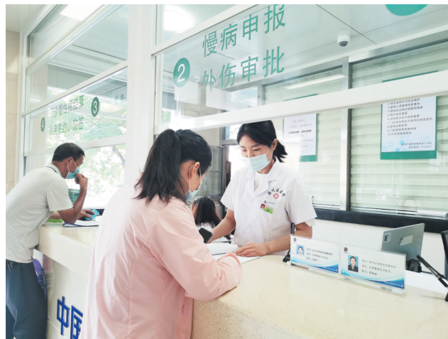
患者家属在淄川区医院医保服务站办理有关手续。