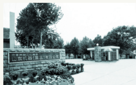
山东机器厂于1949年1月建厂,是我军华东地区的第一个兵工厂。