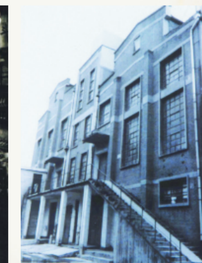
1917年,周村四大机器制丝厂之一——恒兴德丝厂(现为“兰雁集团股份有限公司”)锅炉房。