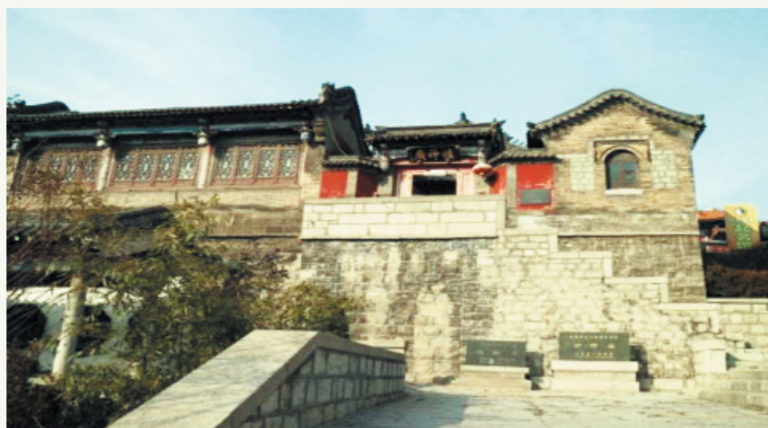
1902年,博山琉璃工人发起了痛打官僚赵尔萃的“炉行之变”。图为“炉行之变”发生地——博山炉神庙。