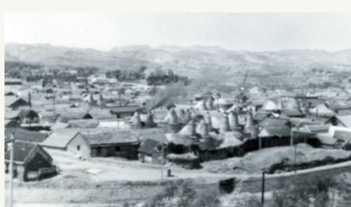
清末博山窑厂全景