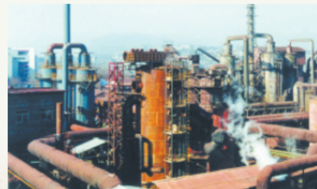
淄博钴厂(现山东东佳集团),是全国最早的四大大钴盐类生产厂家之一。