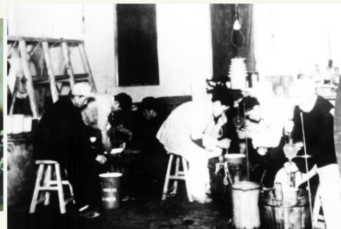
1950年,山东新华制药厂研制治疗黑热病的斯梯黑克。