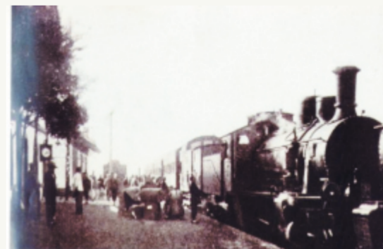
1904年6月,胶济铁路张博支线全线贯通,图为张博支线张店站。