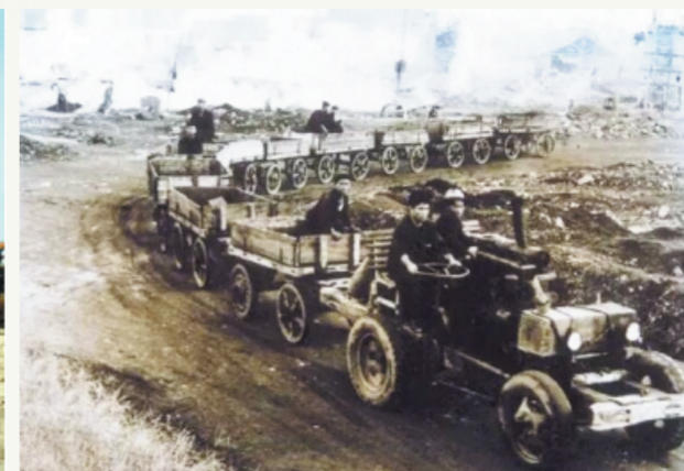
这是1858年拍摄的黑旺铁矿淄河河底矿石采场。