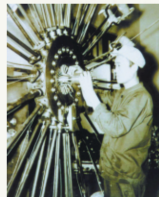
博山电机厂试制生产了大型汽轮发电机。