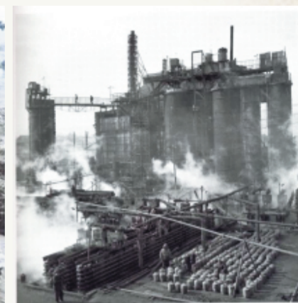
这是1960年淄博制酸厂的生产现场。

今天,“百年之光——党领导中国(淄博)工业百年”主题展在淄博市博山区颜神古镇开启。淄博工业百年,信仰光芒如炬。淄博工业是中国工业一个极具典型性的缩影。站在建党百年和工业百年的时代交汇点上,让我们向历史的纵深回望:从中共一大,到“一五”,再到一百年……党领导下的淄博工业叙写着——一曲壮丽史诗。在这波澜壮阔的伟大进程中,淄博人民以高度的历史自觉、深厚的家国情怀和坚定的使命担当,追逐着远大的工业梦想,探寻着坚实的工业路径,贡献着蓬勃的工业力量。奔向新征程,且看一座工业城市接续起航。