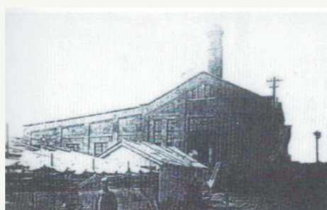
1919年的博山电灯公司