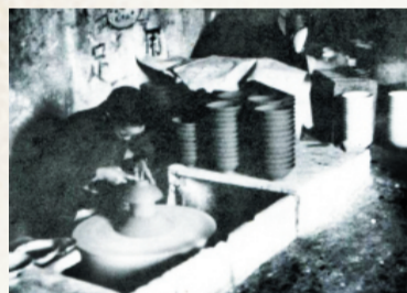
博山陶瓷工人在制碗。