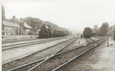
胶济铁路张店火车站