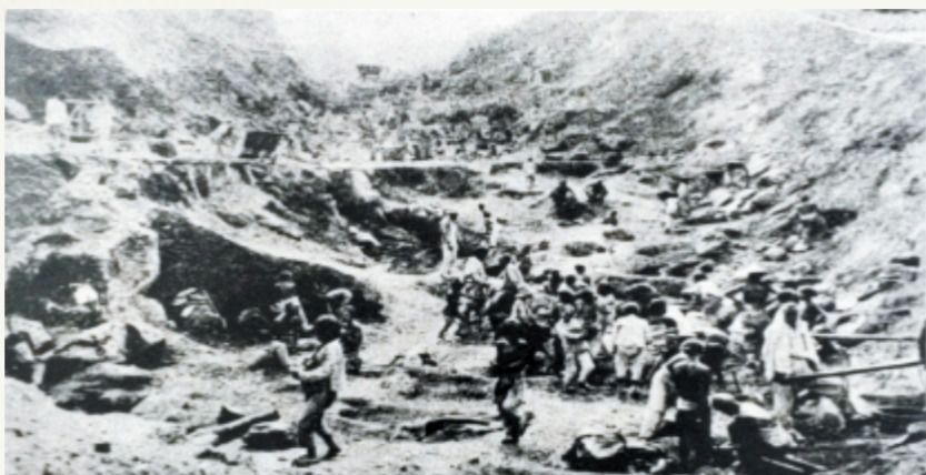
德国侵略者在中埠镇铁冶村雇劳工开采铁矿石。这里是中国冶铁的发源地,春秋战国时期就有采矿冶铁的记录,远远早于欧洲。