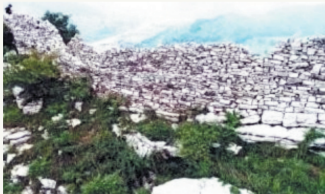
抗日战争时期,日军在博山、淄川矿区一带建造“遮断线”,实施经济封锁,维持矿产掠夺。图为“遮断线”遗址。