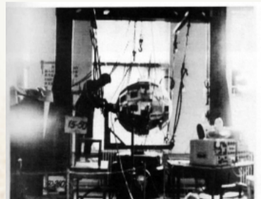
博山电机厂为我国第一颗人造卫星装配电机。