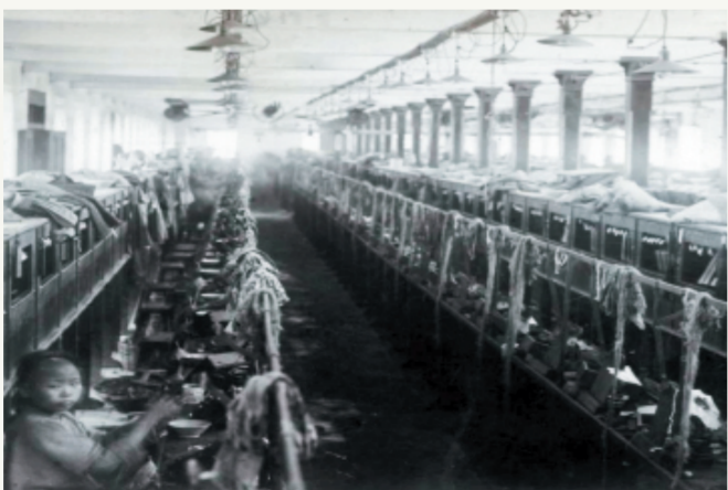
这是1909年拍摄的周村缫丝厂内景。