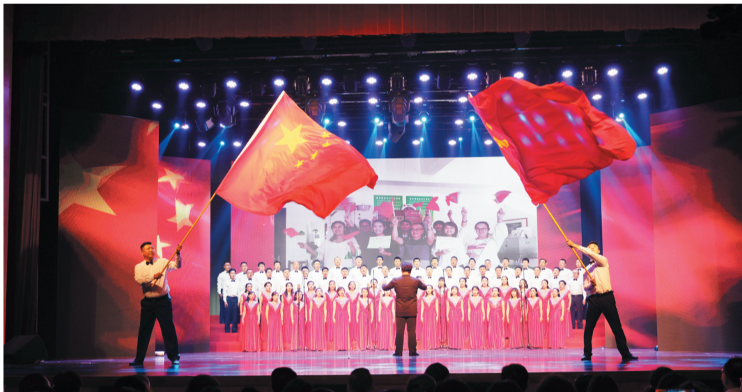
张店分公司党支部参赛队演唱《迎风飘扬的旗》。