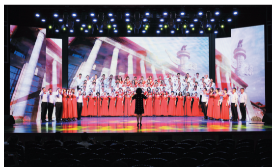
一曲《我宣誓》拉开了比赛的序幕。