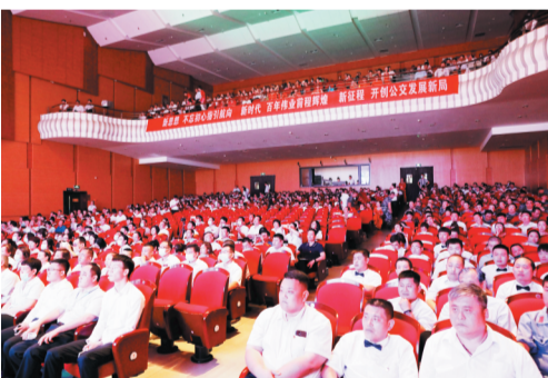
台下观众聚精会神观看歌咏比赛。