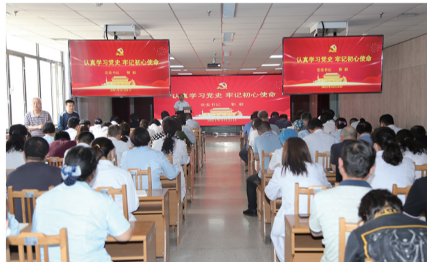
5月21日,淄博市职业病防治院为期一周的党史学习党史牢记初心使命专题教育培训班开班。