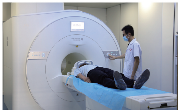
为提升服务能力,造福广大患者,磁共振落户该院投入使用。