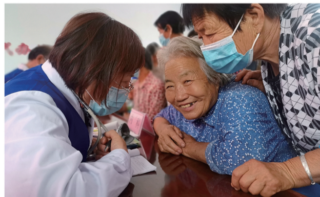
6月25日,医院到淄川寨里镇黑旺村进行老中青专家“走基层”健康宣教及义诊活动。