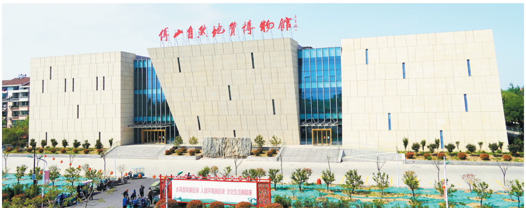
淄博傅山自然地质博物馆外景