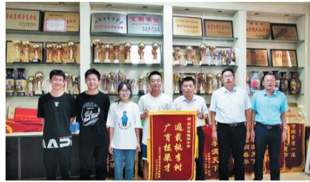
优秀毕业生感恩母校。

加强学生出入校门的管理，做好晚自习和宿舍纪律的检查力度，加强班级考勤工作，做到对违纪学生有事实有依据，对被处分的学生做好档案登记，扎实开展“法律进校园”活动，强化学生的遵规守纪意识和法治意识。