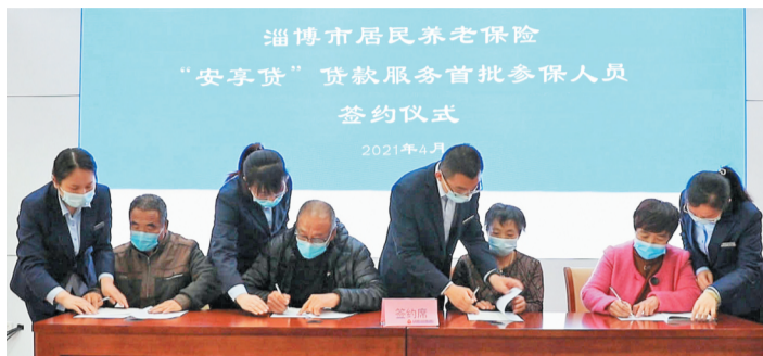
淄博市居民养老保险“安享贷”贷款服务首批参保人员签约仪式

大力推进社会保障卡“民生服务一卡通”建设；开展事业单位“点对点”精准化跟踪服务；做好就业创业保障，建成市级智慧型人力资源市场；推广高校毕业生“电子报到证”，实现网上签约“秒办”；建立工程技术领域专技人才与技能人才贯通机制；推出“安享贷”居民养老保险贷款服务；实现