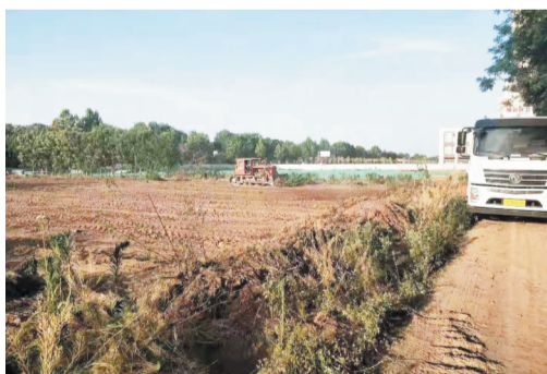
辽河路西延项目征地拆迁顺利完成,现已开工建设。