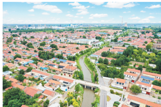
唐山镇生态文明建设不断提升。