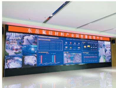
园区智慧平台实现与省平台数据对接。