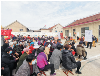
唐山市扎实完成村“两委”换届工作及后续配套组织工作,50个村全部实现换届4个100%。