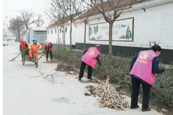
唐山镇持续推进城乡环境大整治精细化管理大提升。