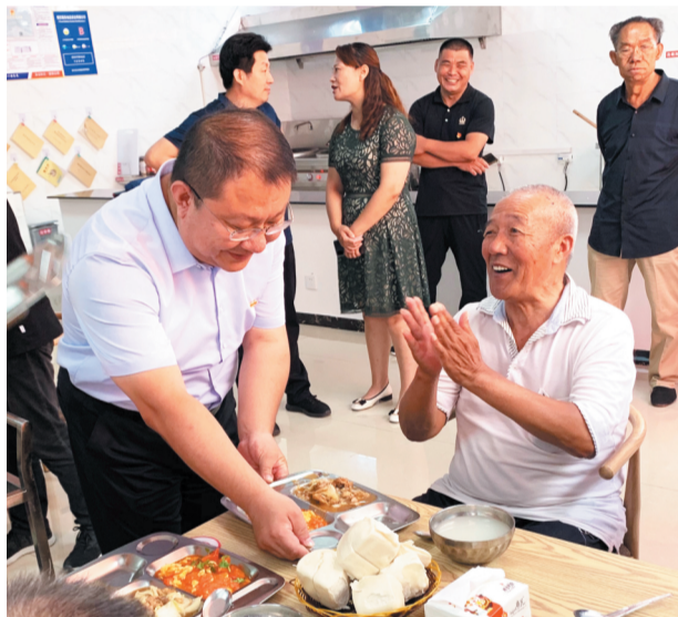
唐山镇大力推进长者食堂建设,让“一餐热饭”成为老年人的“暖心饭”。