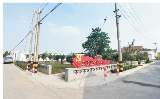
2021年美丽宜居乡村5村连片示范区建设稳步推进。图为西莫王村党史文化广场。