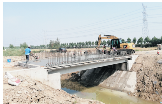
唐山镇投资超110万元兴建水利设施。