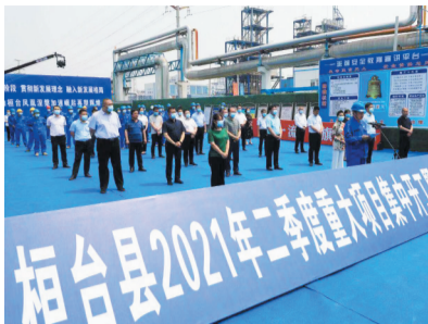
东岳高分子公司高性能含氟聚合物项目开工仪式举行。