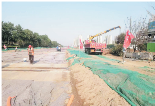
一中西路项目征地拆迁工作顺利完成,现已开工建设。