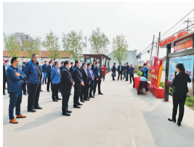
唐山市持续推进“党建+网格”社会信用体系积分制管理,以后七村、贾家村为试点,以点带面、全面开花。全市“党建+网格”现场会在后七村召开。