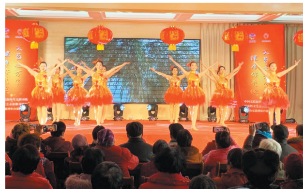
唐山镇开展学雷锋志愿服务活动89场,利用实践站开展暖心帮扶、文艺表演、志愿服务等活动500余场,举办文艺晚会10场、送戏下乡15场、电影下乡200场。