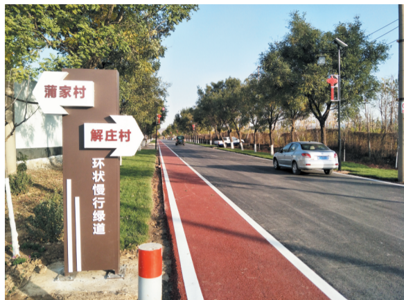
新修环状慢行绿道,提高镇容镇貌。

洪山镇依托丰富的文化旅游资源,加大招商引资力度,先后引进国内知名品牌北京首旅等,总投资110亿元的中华民俗文创园项目正在建设核心区及基础配套设施。引进国内知名品牌行李旅宿,总投资5.2亿元的“青未了”旅宿项目一期工程正式对外开放,二期将借助国内顶级设计和品牌力量,建设52套高端民宿,今年10月对外开放。