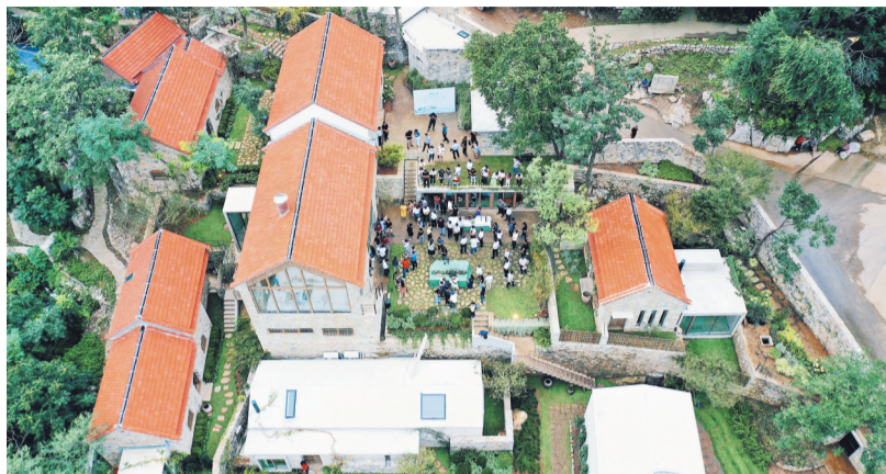
“青未了”旅宿项目一期工程正式对外开放。

引进国内知名品牌上海驴妈妈集团,投资蒲家庄古村落保护性开发及聊斋城商业开发,目前已完成村庄整体搬迁,正在进行规划设计。