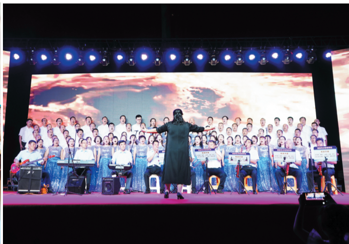
群众唱红歌铭记红色历史。

初心不忘，使命在肩，走得再远都不能忘记来时的路。昆仑镇还组织开展了一次溯源之旅，镇机关党总支来到沂源县618战备电台旧址，再走红色之路、重温入党誓词，探寻历史遗迹、见证不变初心。昆仑镇各村居组织党员积