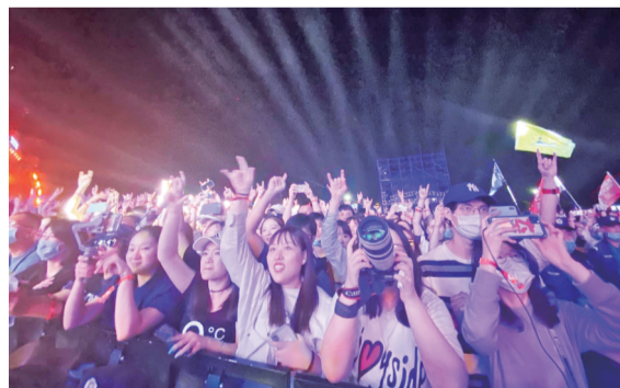
2020淄博麦田音乐节吸引了众多年轻人，其中也包括许多外国友人。各类音乐节、啤酒节等活动的举办，为淄博增添了更多的时尚活力。