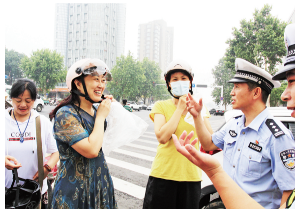
淄川交警在路口现场发放头盔。