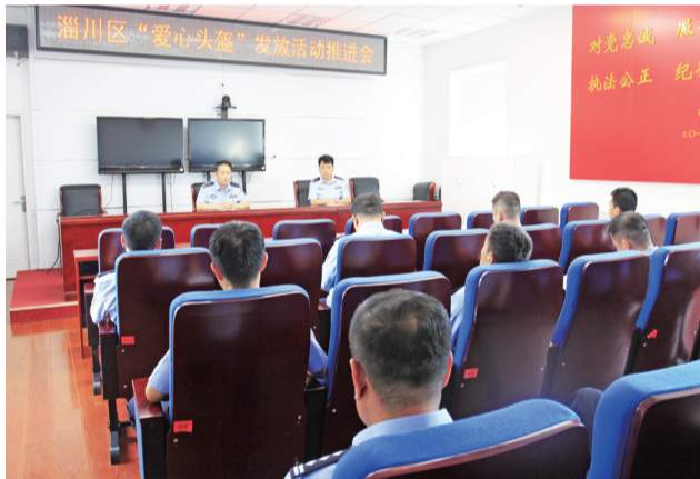
淄川区“爱心头盔”发放活动推进会。