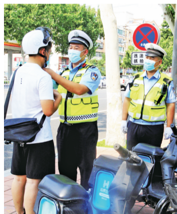
民警劝导共享单车骑乘人佩戴安全头盔。