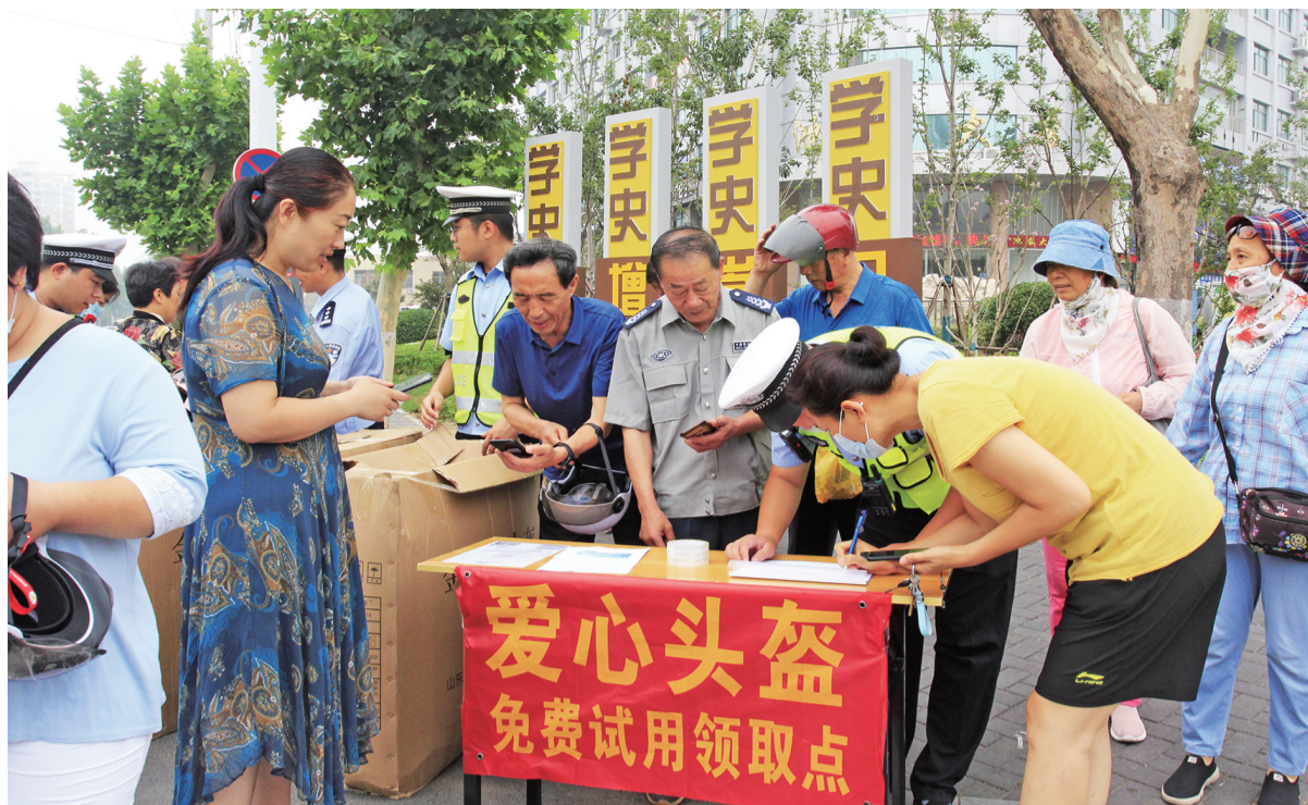
淄川交警设立头盔发放点方便群众领取。

为进一步提高电动自行车骑乘人员安全防护水平,有效减少电动自行车交通事故伤亡率,淄川市公安局交通警察支队淄川大队结合辖区实际,加强宣传引导,发动社会力量积极推进“爱心头盔”的发放工作,努力提升头盔佩戴率。目前,淄川交警共设置“爱心头盔”发放点52处,已发放22474个,其中成人头盔21375个,儿童头盔1099个。