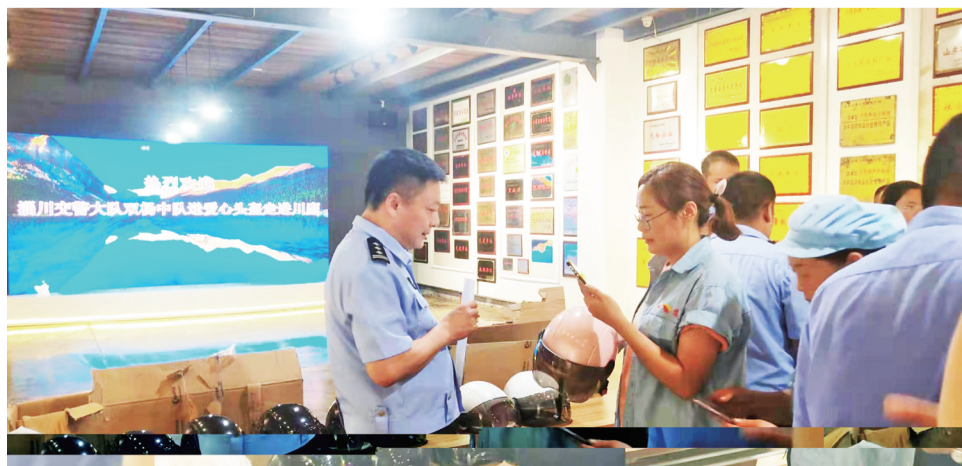
淄川交警送头盔进企业。