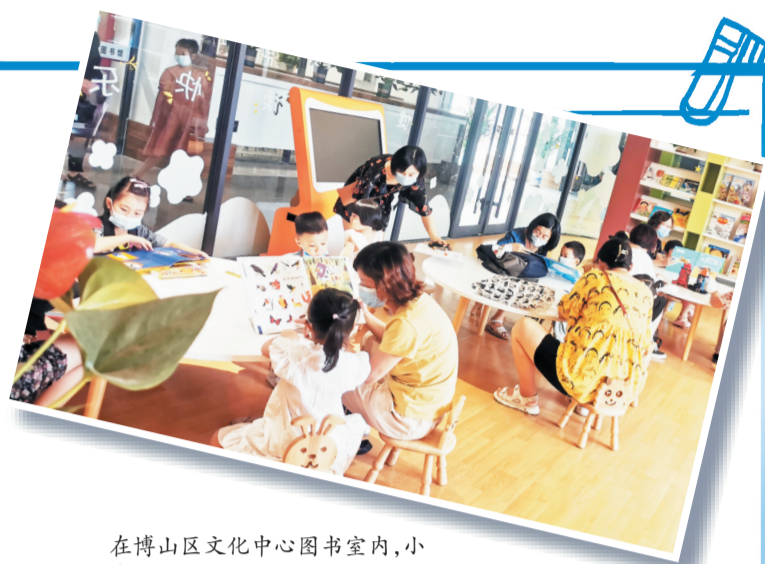
在博山区文化中心图书室内,小朋友在家长的陪伴下看书。